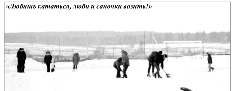
«Любишь кататься, люби и саночки возить!»